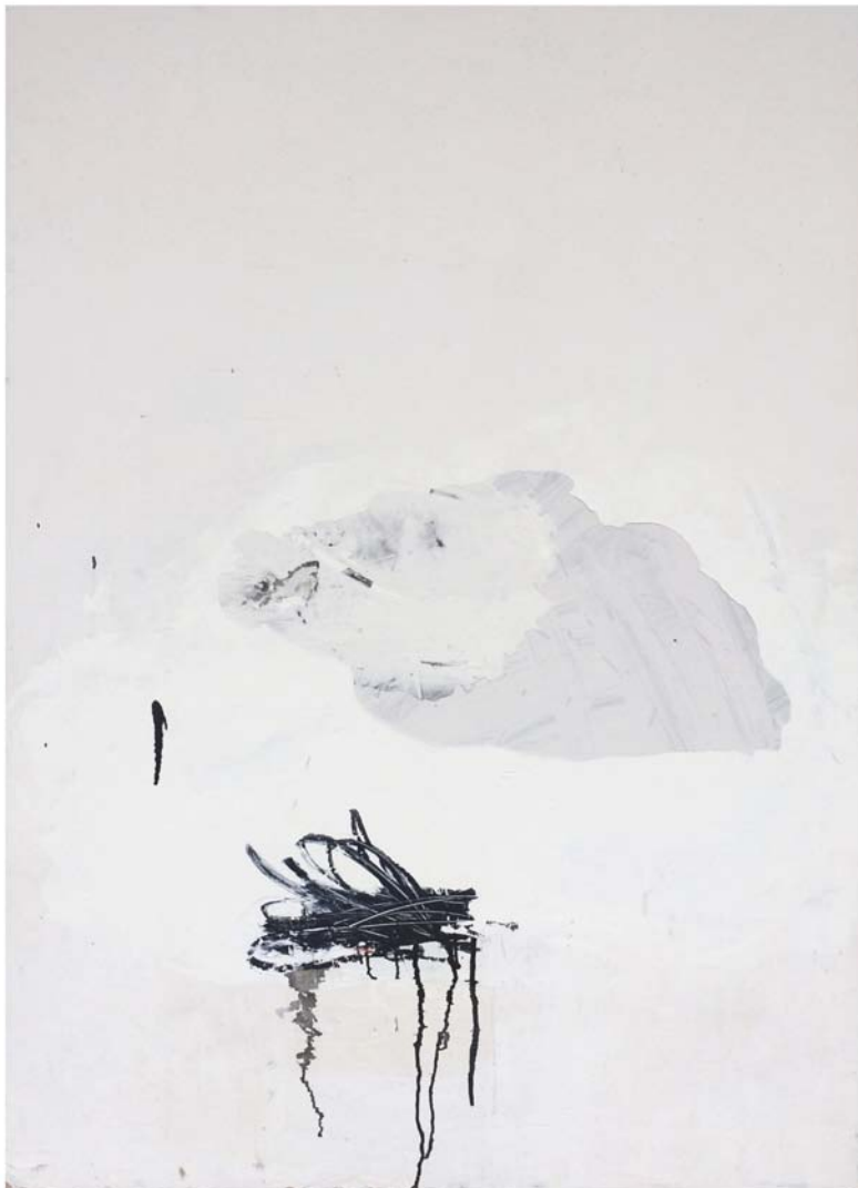
Marion Brosse, peinture