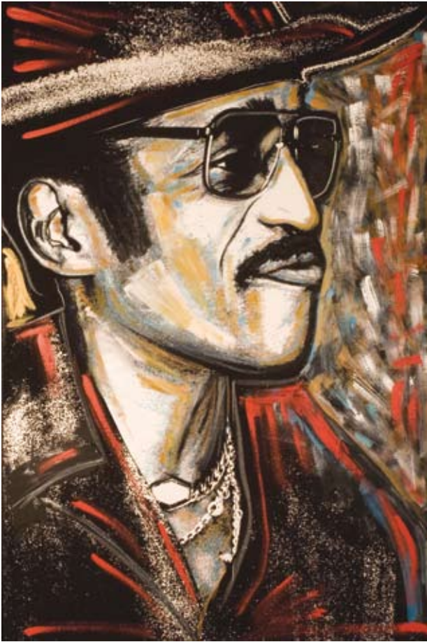
Sammy Davis Junior

► posant donnent l'impression d'approcher au plus près de l'âme des modèles.